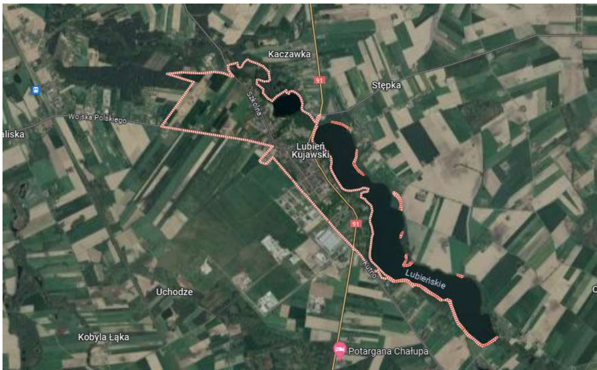
fot. 1 Miejscowość Lubień Kujawski, fragment map, ( google.pl )

Miejscowość Lubień Kujawski położony jest w województwie kujawsko-pomorskim, w powiecie włocławskim, w gminie Lubień Kujawski.