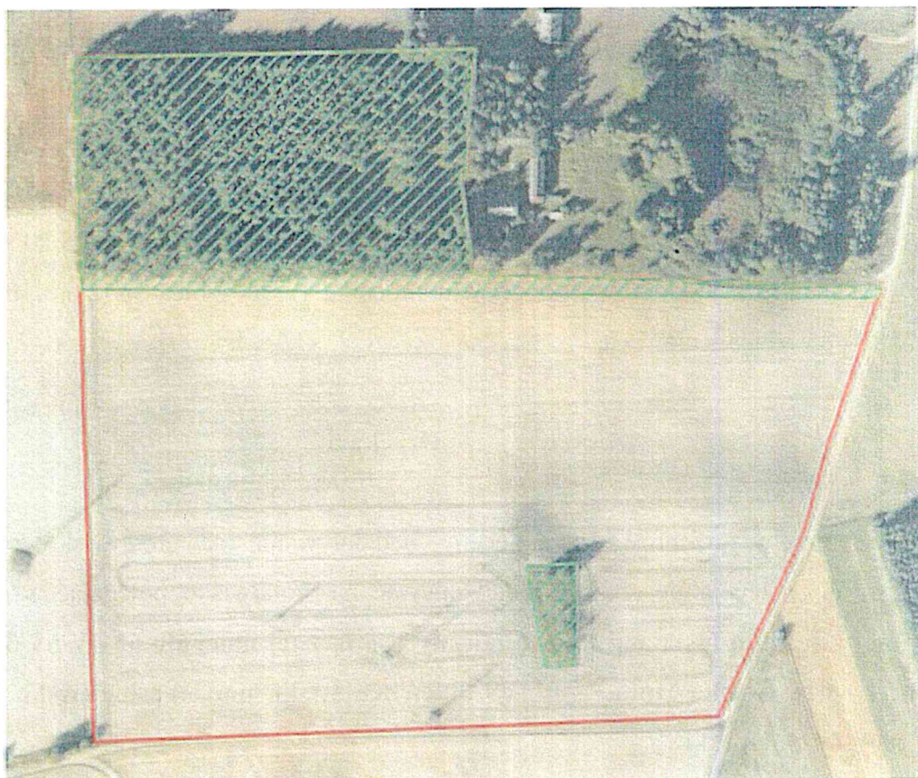
Rys. nr 1 Plan zagospodarowania terenu zamierzenia.