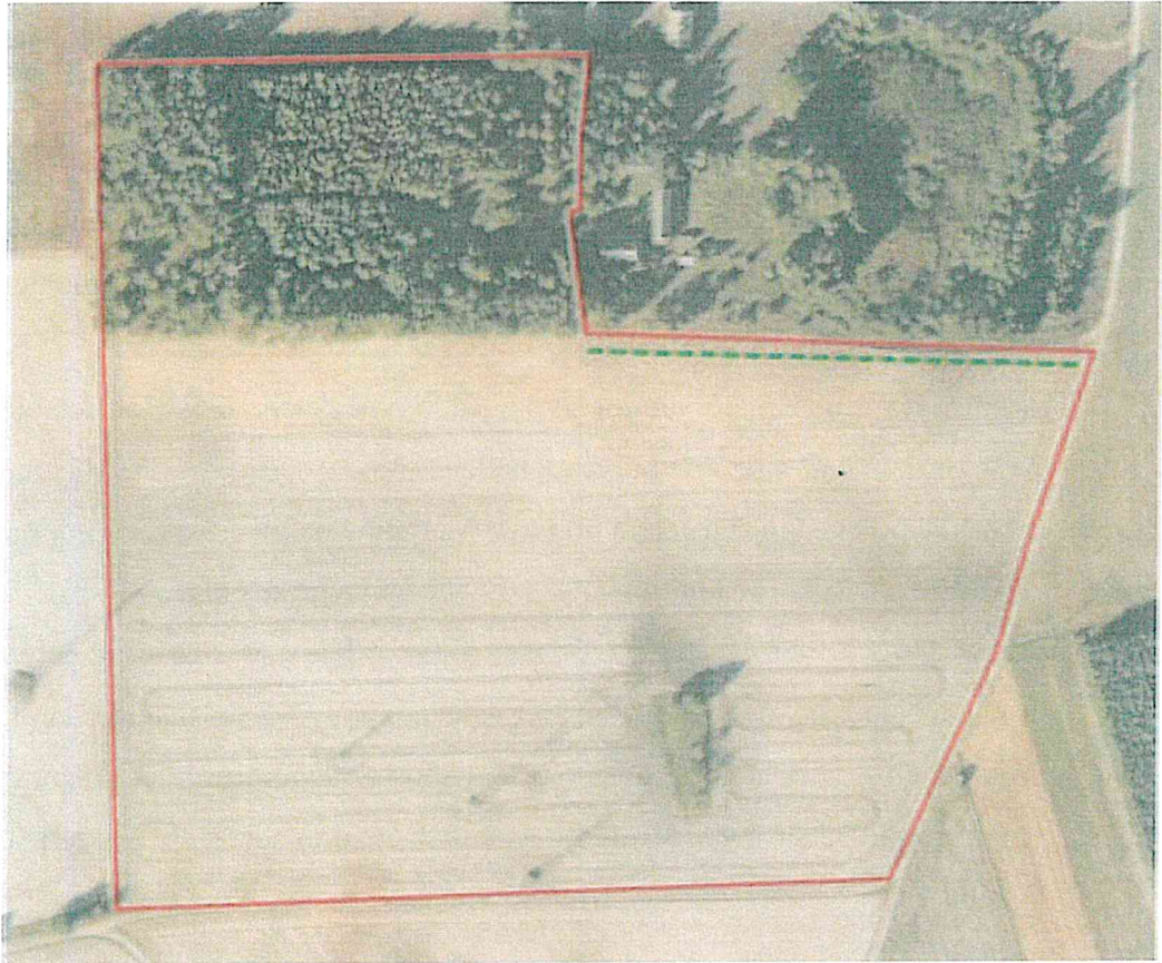
Rys. nr 2. Plan nasadzeń zieleni izolacyjnej.