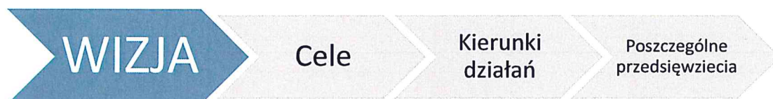
Rysunek 12. Instrumentarium procesu urzeczywistnienia wizji obszaru rewitalizacji

Jak już przedstawiono powyżej, wizja obszaru rewitalizacji określa docelowy stan pożądany procesu rewitalizacji, a jej urzeczywistnieniu służą szczegółowe cele strategiczne oraz kierunki działań rewitalizacyjnych (stanowiące sposób/drogę osiągnięcia celów), składające się z konkretnych kroków - realizowanych przedsięwzięć (a w ich ramach projektów) rewitalizacyjnych (zob. rys. 12).