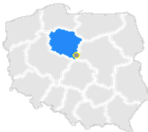
Rysunek 1. Mapa Gminy Lubień Kujawski

Gmina Lubień Kujawski zajmuje obszar 202,3 km 2 . Według danych GUS Gmina liczy 1.363 mieszkańców, a gęstość zaludnienia to w przybliżeniu 50.6 osoby/km 2 . Gmina Lubień Kujawski położona jest w województwie kujawsko-pomorskim.