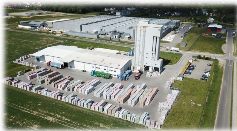
Kreisel Technika Budowlana Sp. z o.o.