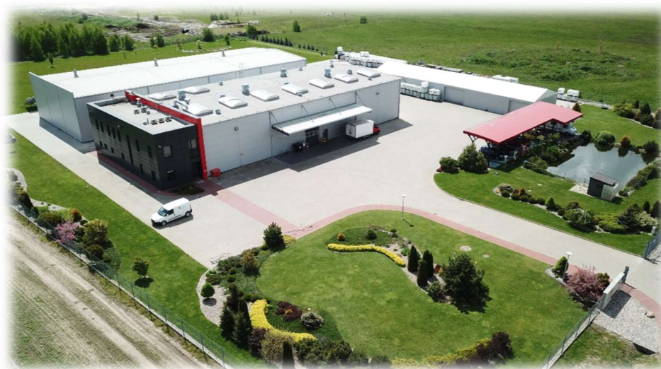
Sulima Sp. z o.o.