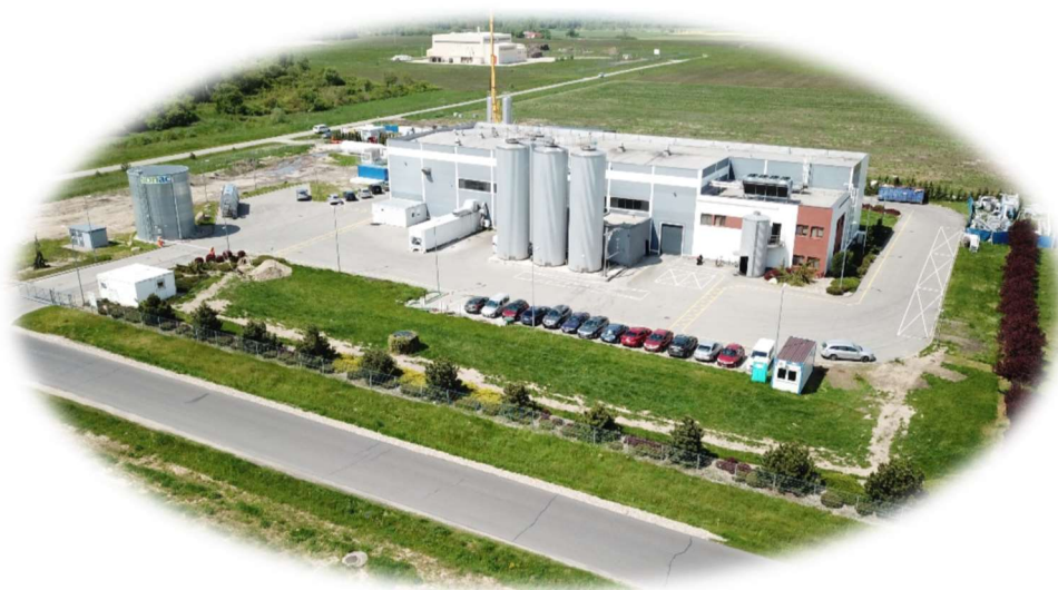
Sonac Sp. z o.o.