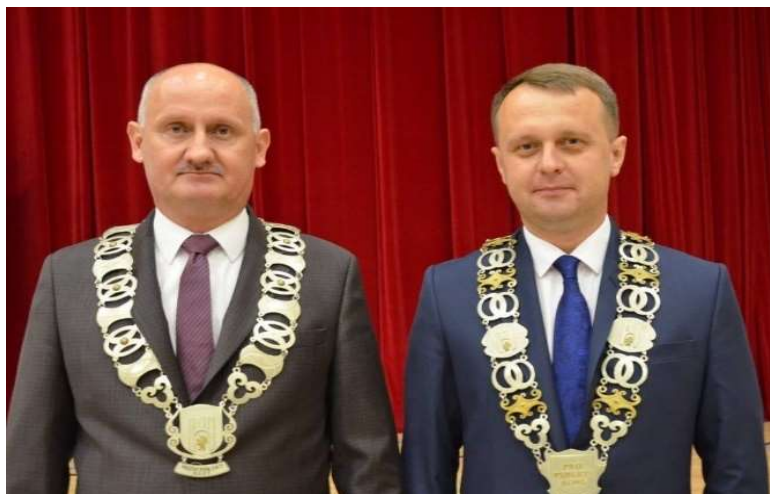
(Przewodniczący Rady Miejskiej i Burmistrz Lubienia Kujawskiego)