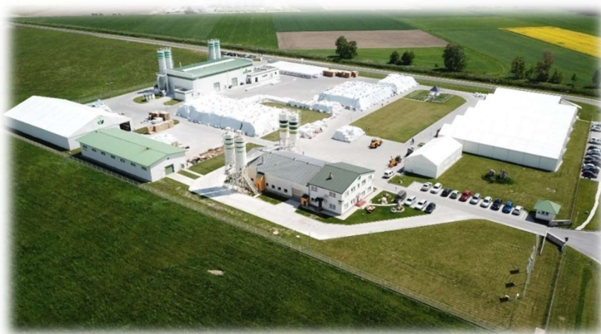
Polcale Sp. z o.o.