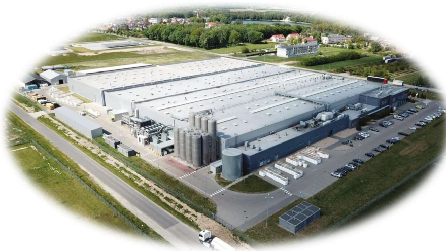
Berry Superfos Sp. z o.o.