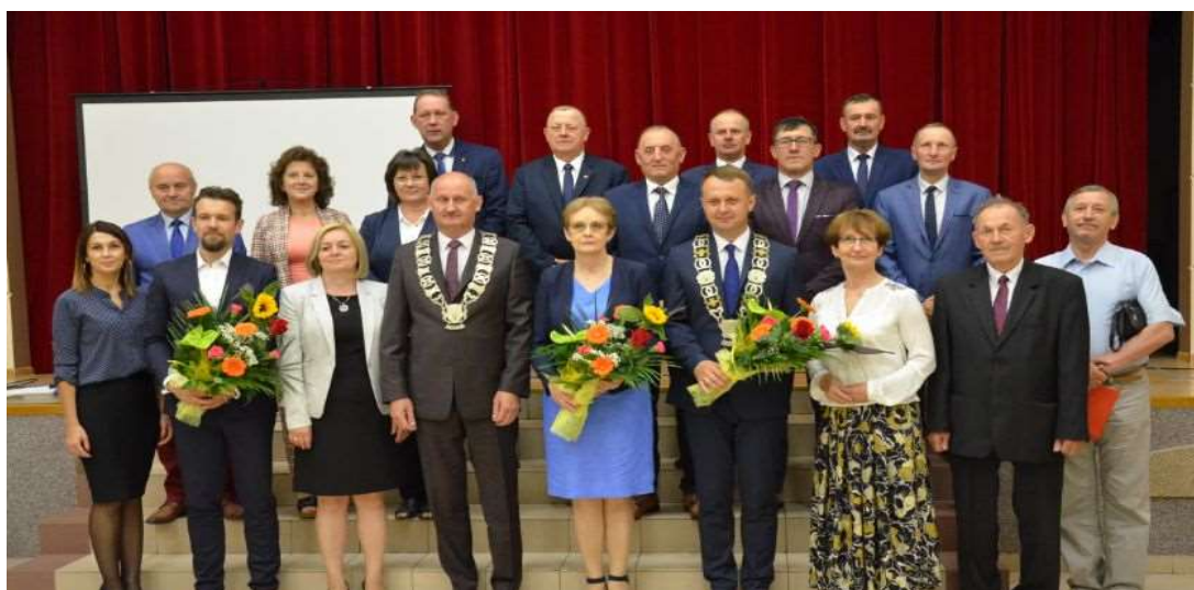
Rada Miejska w Lubieniu Kujawskim kadencji 2018 – 2023

Rada Miejska w Lubieniu Kujawskim powołała następujące komisje stałe: komisja rewizyjna, komisja skarg, wniosków i petycji, komisja budżetowo – gospodarcza, komisja rolnictwa i ochrony środowiska, komisja oświaty, kultury i sportu, komisja zdrowia i spraw socjalnych oraz komisja bezpieczeństwa i porządku publicznego.