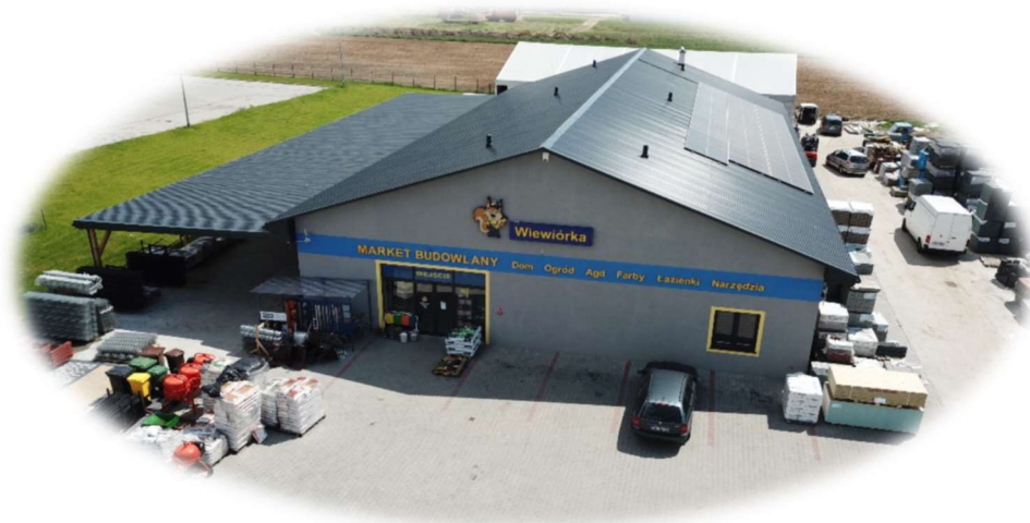
Market budowlany „Wiewiórka”