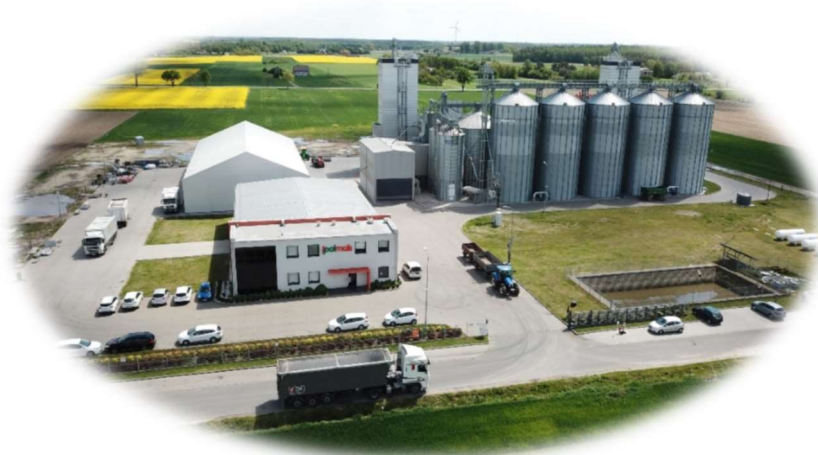
Polmais Sp. J.